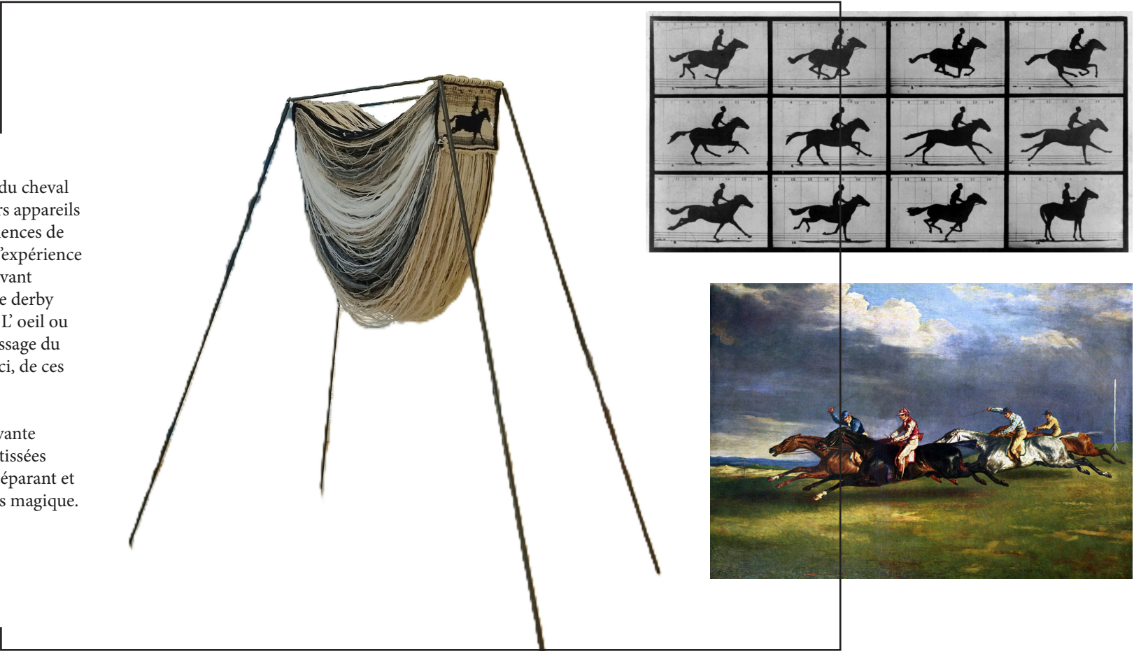
2 -Palimpseste 9 formats A4, lithographie, 2020.

La décomposition des mouvements du cheval au galop de Muybridge avec plusieurs appareils et du fil est une des premières expériences de chronophotographie. Le résultat de l'expérience contredit la façon dont on peignait avant les chevaux au galop, comme dans Le derby d'Epsom de Géricault. Qui dit vrai ? L'oeil ou l'appareil photo ? Réflexion sur le passage du temps, de notre perception de celui-ci, de ces intervalles. Les photographies précédente et suivante de l'illusion du «vol» du cheval sont tissées ensemble par une masse de fils les séparant et les reliant, traduisant cet entre-temps magique.