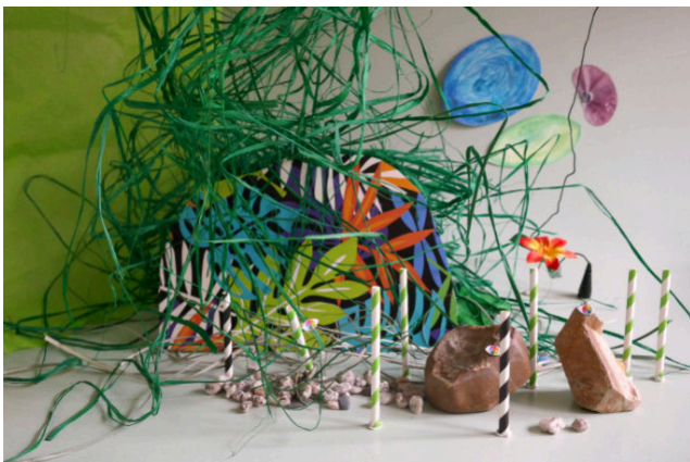
Paysage agité de Sam Moore, #1 - Dec 2019