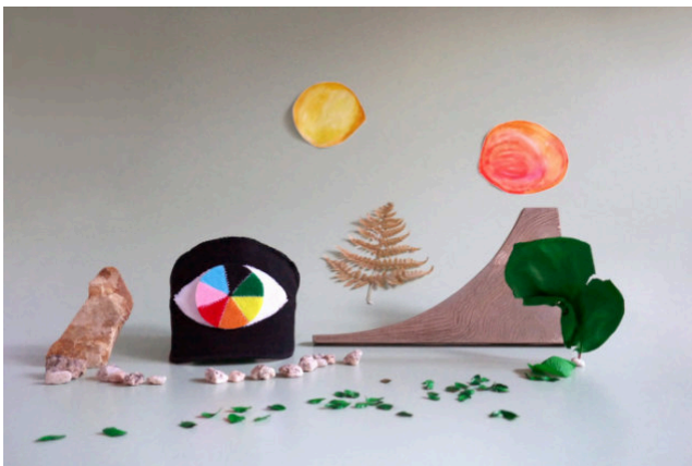
Paysage agité de Sam Moore, #2 - Nov 2019