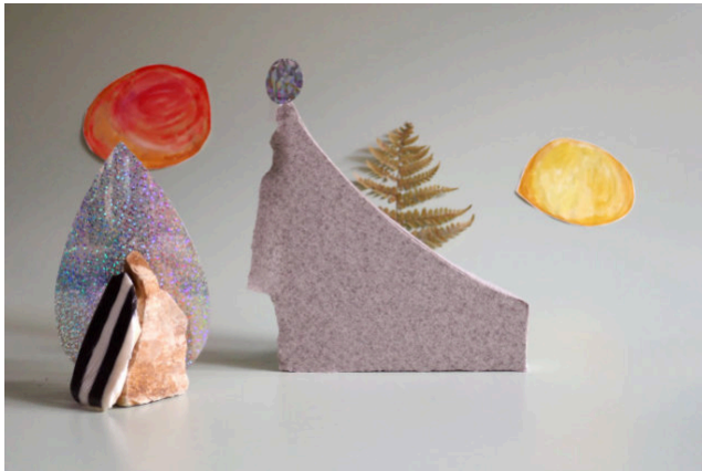
Paysage agité de Sam Moore, #1, Sept 2019

Proposition 1 : Sélection d'un ensemble de 5 photographies (40 x 60 cm chaque)