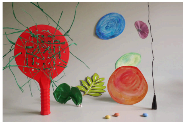
Paysage agité de Sam Moore, #3 - Nov 2019