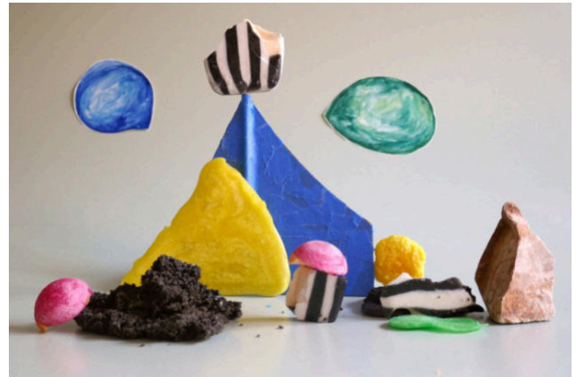
Paysage agité de Sam Moore, #3, Sept 2019