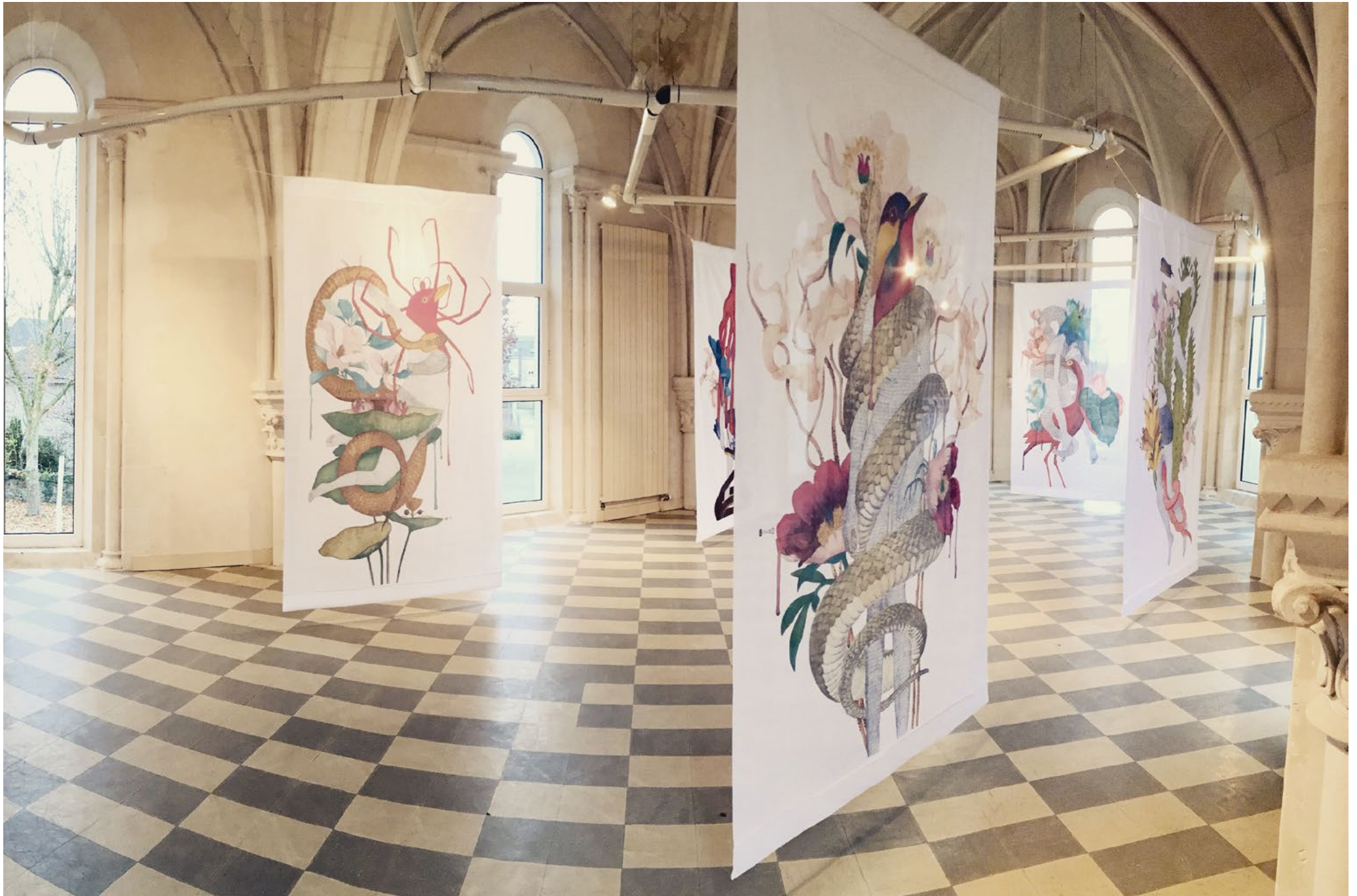
NATURALIS • Vénus Série de 8 dessins